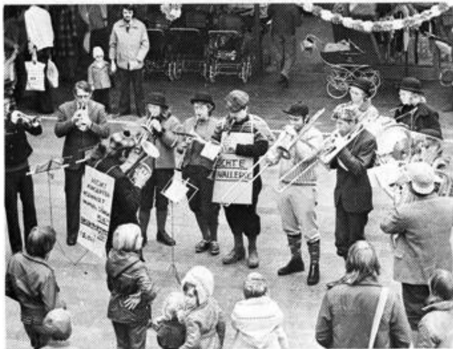
LIETORVET har vært et fast spillested for Suonis smågrupper. Her er en liten gruppe på PR-opdrag for konserten med Sinsen Musikkorps høsten 1973.