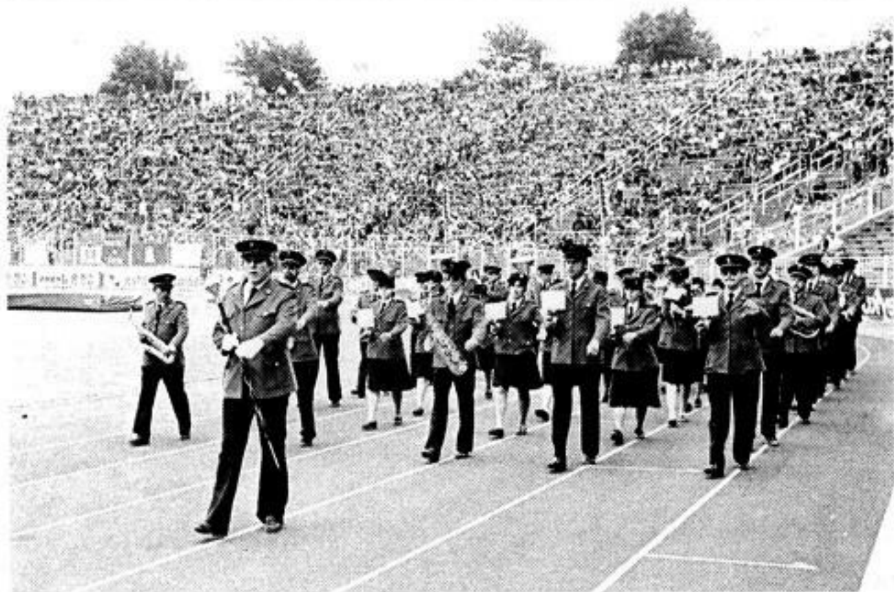
HAMBURG 1982: Suoni spilte i pausen på Volksparkstadion under Bundesligakamp mellom Hamburger S.V. og Karlsruhe.