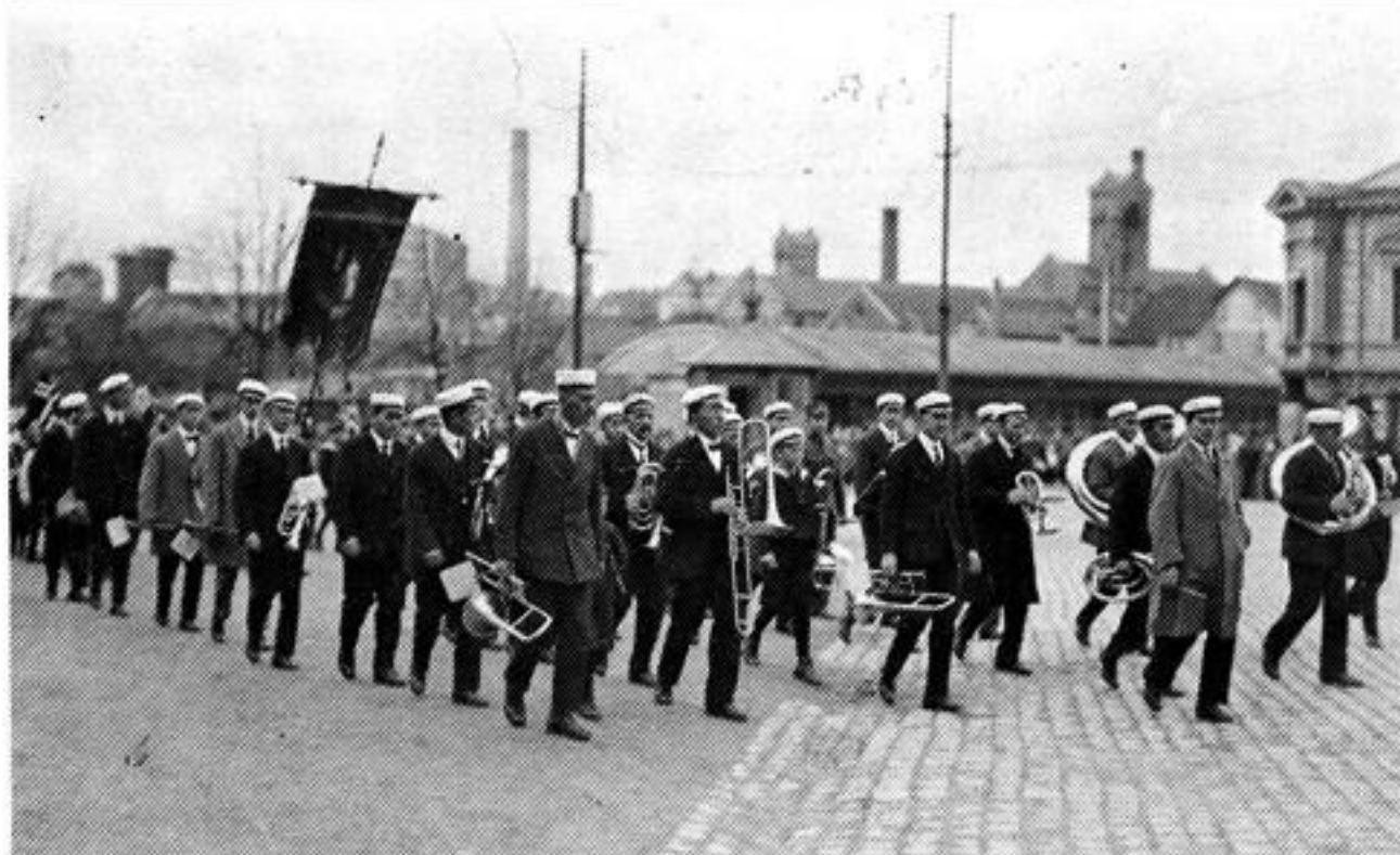
SUONI I 17. MAI-PARADE først i 1930-årene. Bildet er fra Fiskesteppet.