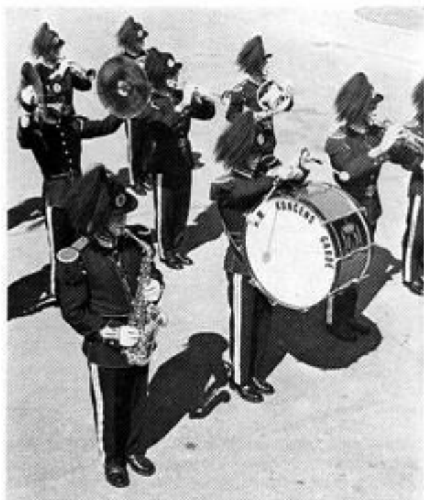
H.M. KONGENS GARDES MUSIKKORPS har gjestet Suoni 4 ganger — i 1960, 1974, 1976 og 1978.

På korpsets årsmøte høsten 1972 ble det behandlet hele 5 innsendte forslag fra medlemmene. Disse forslagene inneholdt ønsker om musikalsk og aktivitetsmessig «opprustning», om marsjtrening innendørs, om oftere bruk av fana og om årvisse medlemsfester. Det siste hadde merkelig nok vært et problem en tid, p.g.a. sviktende interesse blant medlemmene! Flere av disse sakene fikk en positiv behandling av årsmøtet, med klare signaler på at nå måtte «noko gjera».