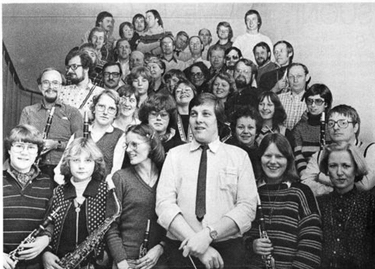
Øvelseskveld på Skien videregående skole 1980.

ikke hatt i Ibsenhuset, og ville heller ikke få det på Skien videregående skole. Dette behovet ble for en stor del løst da korpset fikk leie noen rom i Liegata 19, som tilhørte Skien kommune. Her ble det plass for det etterhvert omfattende notearkivet, lager for instrumenter og uniformer, og ikke minst en brukbar «salong» til styremøter, gruppemøter og gruppeøvelser. Det historiske i dette leieforholdet var at nå hadde Suoni et sted som var Suonis — og ingen andres!