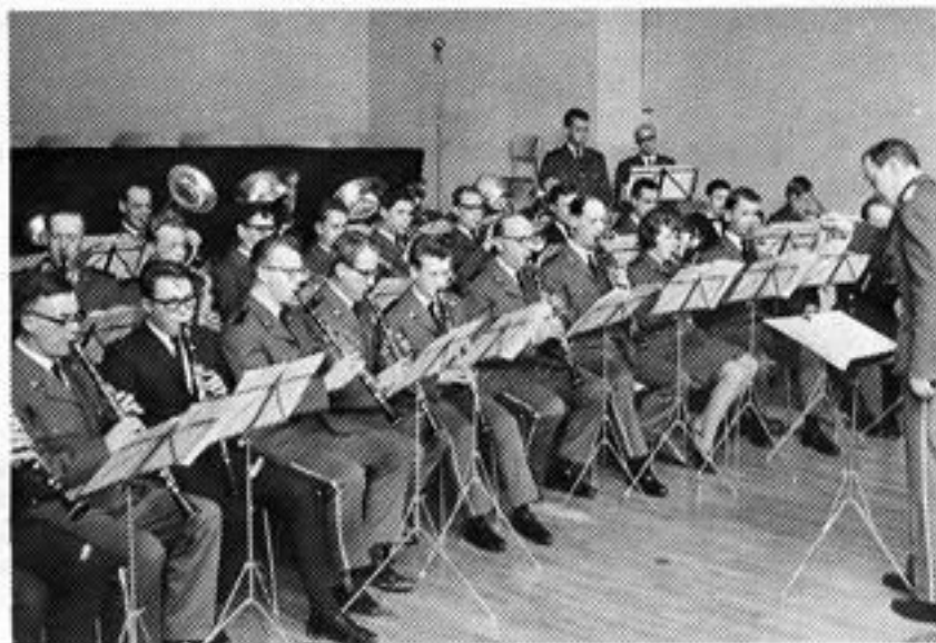
Konsert 15/3-64 på Høyers Hotell — første opptreden med de røde jakkene.

sammen til ett brukbart korps. I pinsen var igjen Kristiansand stedet for stevne, og her benyttet Suoni og S. U.K. anledningen til å lage en ekstra fellesparade gjennom sørlandsbyens gater.